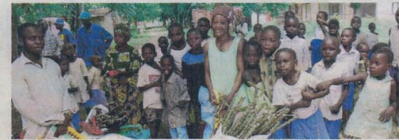
Mostra de la distribució de l'ajuda d'emergència que féu VSF a Uvira, a la RDC del Congo.