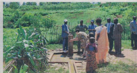
L'accés a l'aigua potable ha millorat considerablement la vida d'aquesta comunitat de 900 pigmeus.

La col·laboració de VSF al desenvolupament d'aquesta comunitat ha anat però més enllà. Una primera acció que es dugué a terme fou la lluita pel dret al matrimoni civil i a la terra, que es concretà en l'enllaç de 28 parelles. A cada un d'aquests matrimonis, l'entitat li va regalar una cabra, un element clau per a la seva subsistència. Posteriorment, s'han desenvolupat microprojectes d'agricultura i ramaderia, amb l'aportació de llavors i conills per a la comunitat. A més a més, s'hi ha millorat la higiene i la salut, ja que s'ha aconseguit transportar aigua potable i instal·lar-hi latrines i rentadors públics, que han "canviat per complet" la imatge del poble. En definitiva, un projecte per contribuir-hi un millor futur que retorna la dignitat al poble.