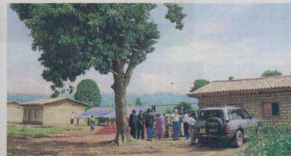
Les cases representen un pas endavant i un canvi en la vida d'aquestes persones.