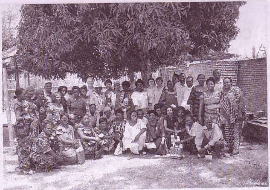
TALLER DE COCINAS SOLARES EN UVIRA

- Solo remarcar que si alguien quiere colaborar o hacerse socio de Veïns Sense Fronteres , estos son nuestros datos c/ Bisbe Cabanelles, 33, bajos Palma de Mallorca Tel. 971 242 716 Fax 971 242 109 Núm. de cuenta (La Caixa): 2100 1406 0200057431. También pueden ponerse en contacto conmigo en Centre Tecnològic de la Indústria Balear Av. des Parc, 80, bajos, Manacor, Tel. i Fax 971 84 50 74.