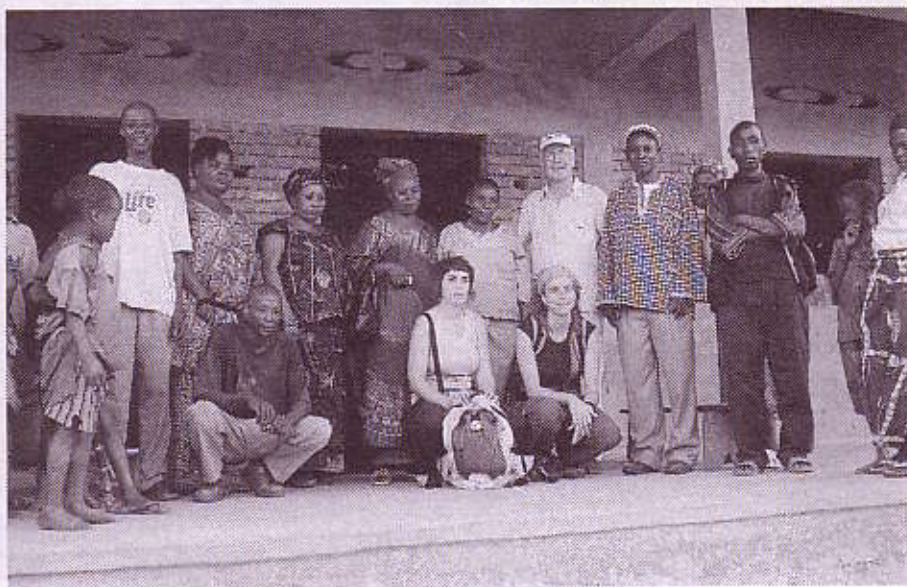
ESCUELA DE KIRIRI EN CONSTRUCCIÓN (CONGO)

- Se trataba de llevar a cabo una prospección sobre las posibilidades de desarrollar en Burundi un turismo sostenible. En el trabajamos varios equipos de Veïns Sense Fronteres que nos íbamos turnado en Burundi para desarrollar un trabajo asignado de antemano. El primer grupo fue durante agosto y el mío, que fue el último, visitó Burundi en octubre. El primer grupo identificó infraestructuras (carreteras, instalaciones, etc.) para ver que tipo de turismo podían absorber. Otro grupo investigó los aspectos culturales que pudieran resultar interesantes para el turismo, como por ejemplo