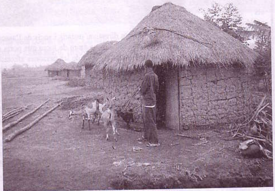
CASAS DE PIGMEOS