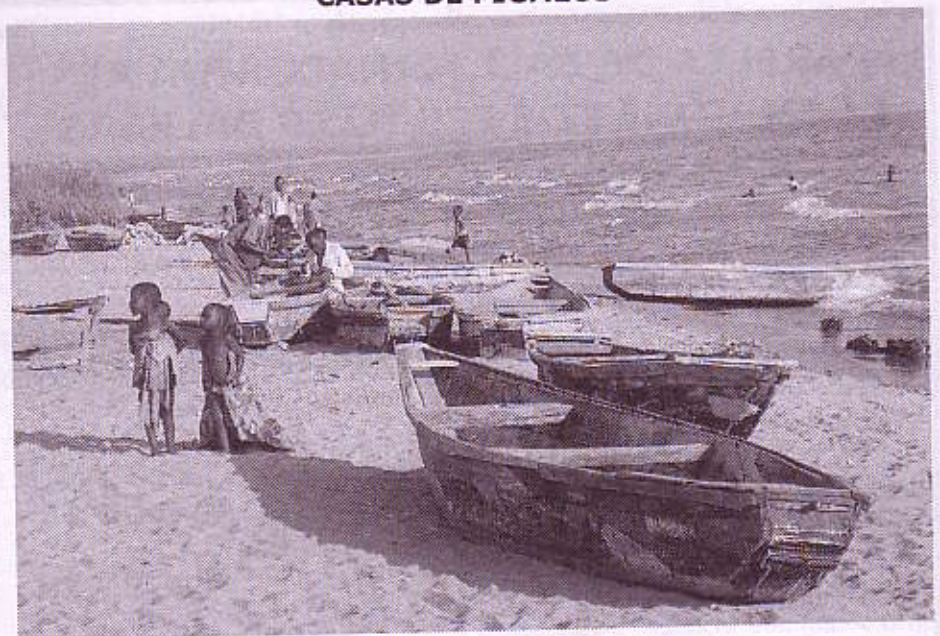
LAGO DE NYANZA