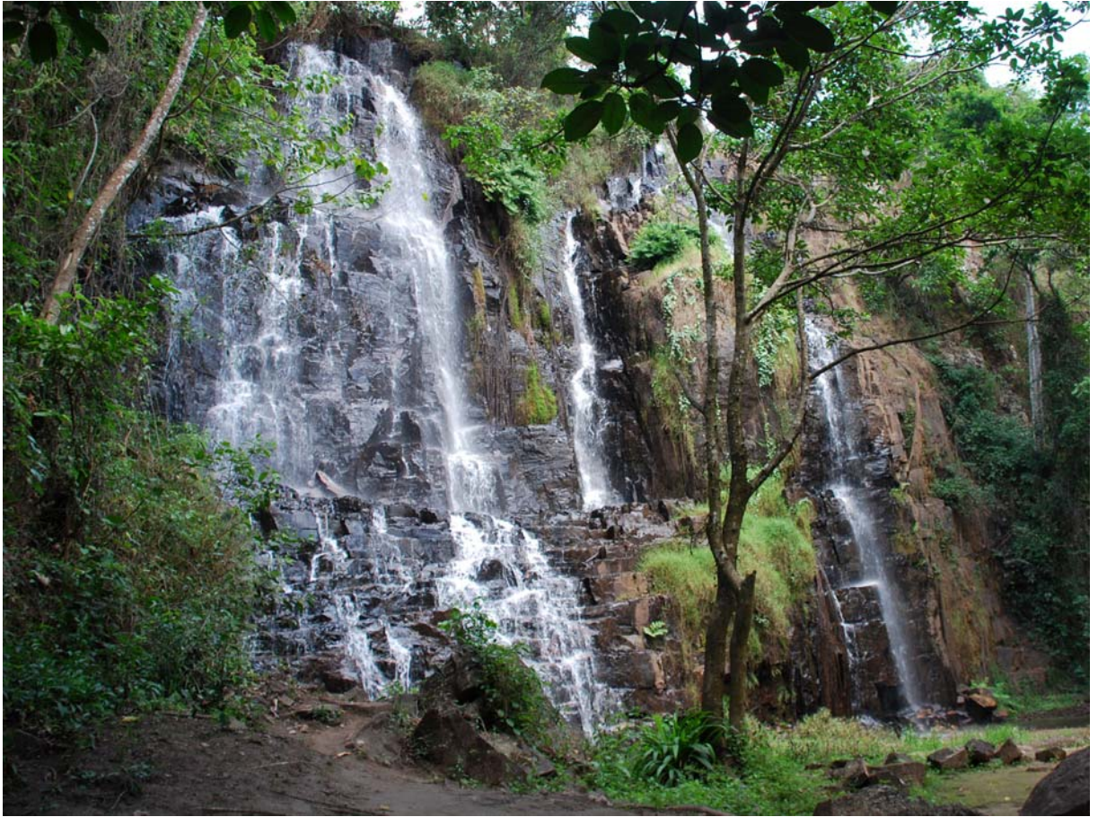
Cascades de Karera