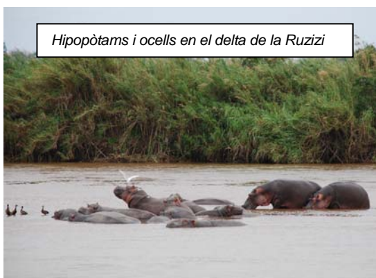
Hipopòtams i ocells en el delta de la Ruzizi

1.- Que Burundi té l'avantatge d'oferir un seguit d'atractius que cap altre país pot presentar al turista perquè s'hi troba una extraordinària riquesa natural, repartida en una superfície relativament petita, de tal manera que és perfectament possible que gairebé tots els hàbitats naturals, d'una gran varietat, puguin ser visitats en uns pocs dies de viatge, la qual cosa pot esdevenir el gran al·licient per al turisme que cal desenvolupar: