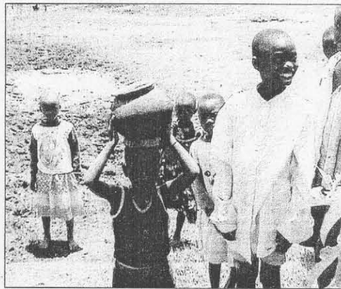
Niños de Burundi, un país castigado por la guerra y la pobreza.

La narración El meu país, Burundi pretende presentar esta cruda realidad de manera que no cree desaliento, a fin de que los lectores puedan ver que, en paralelo a otros esfuerzos, la complicitad y la solidaridad de cada una de las personas son capaces de construir un mundo de esperanza y de ilusión en relación a alguno de estos seres a quienes se les ha expoliado el derecho de vivir y crecer dignamente.